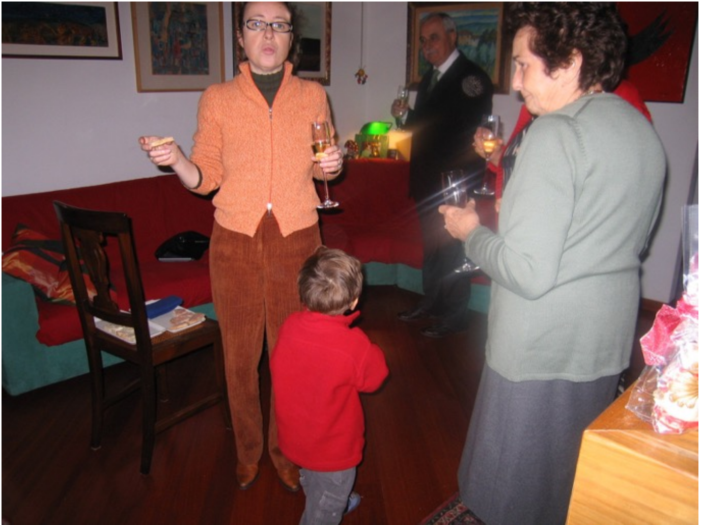
Poi si va a tavola. Bene il vino Amarone di 10 anni era eccezionale. Eccezionale anche come