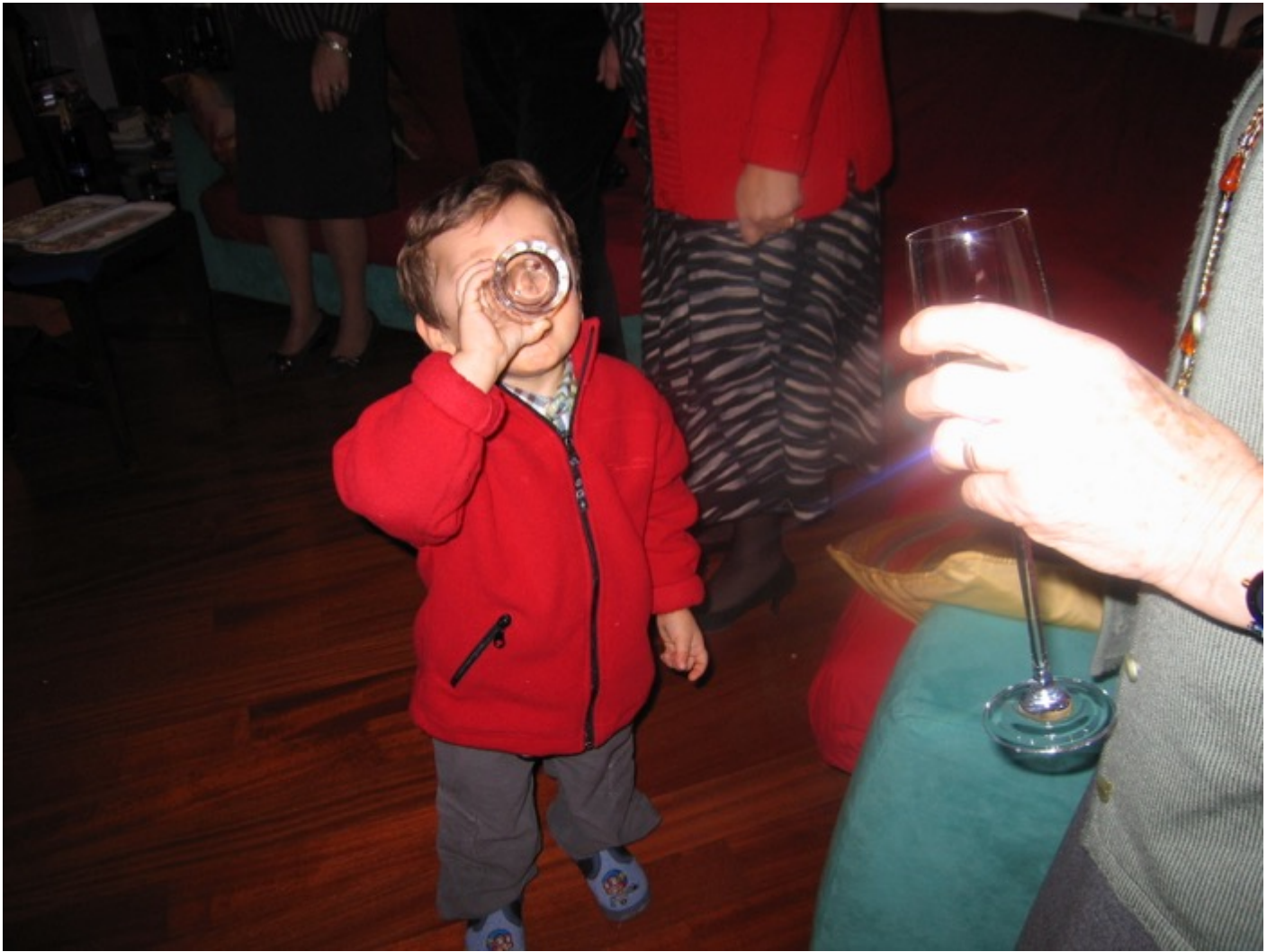
Freddino di Mara e Pierpaolo ma si vola alti. In complesso non si percepisce. Crostini e