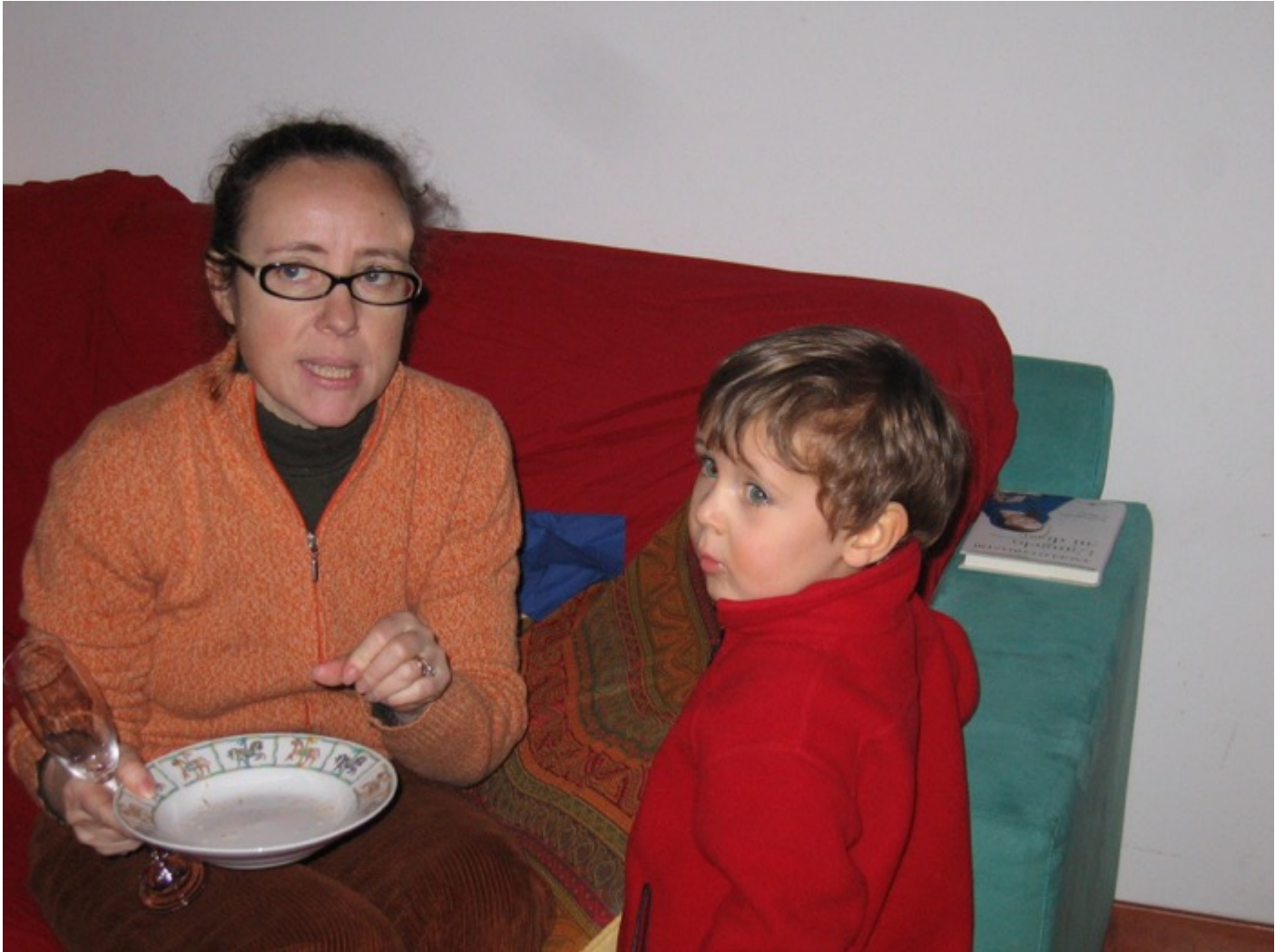
al solito la galantina di Mamma. Buoni i tortellini in brodo. Bene anche il gran pezzo anche