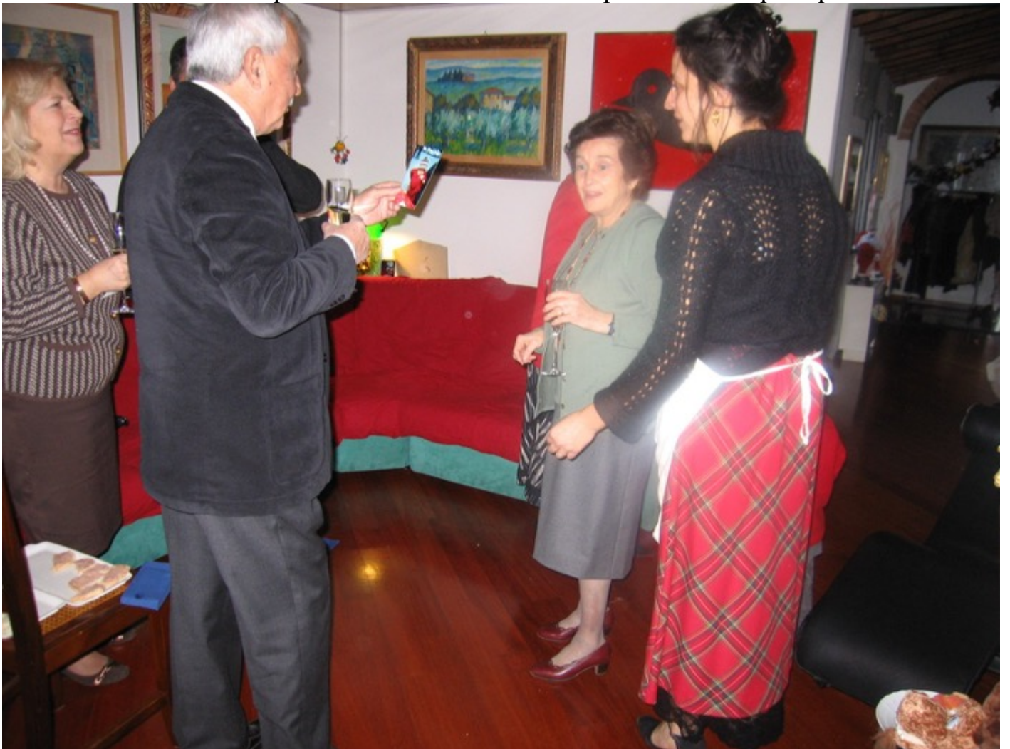
brindisi a Champagne, crostini, alcuni di quelli che mi piacciono, fegato, salmone meno quelli al tartufo dove si ha la sensazione di aromi chimici.